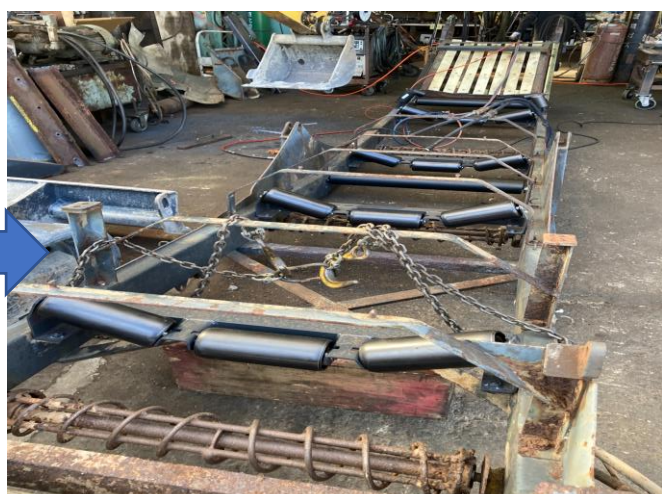
ベルコンローラー兼ブラケット全数交換