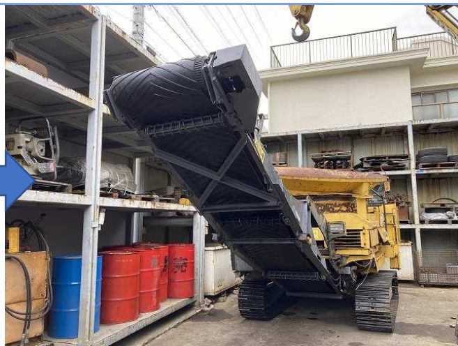
ベルコンゴム交換