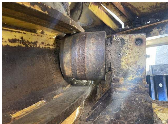
ホッパーガイドローラー付近錆び