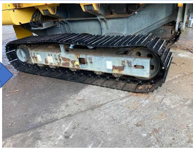
シューリンク交換