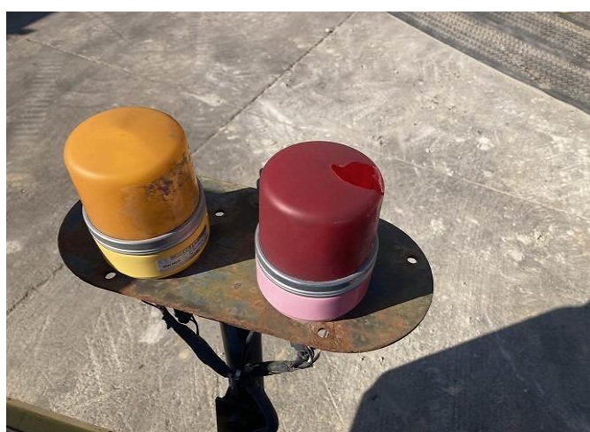
回転灯赤レンズ割れ作動不良