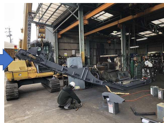
ベルコンフレーム簡易塗装