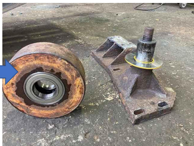
ホッパーローラーベアリング(兼シャフト)修正