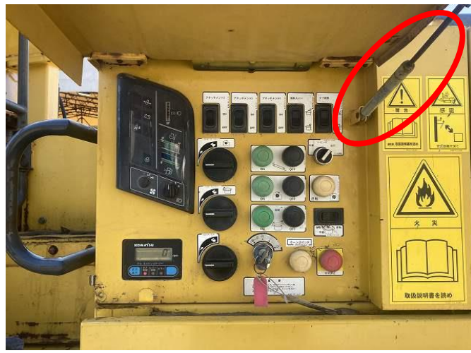
操作パネルダンパー不良