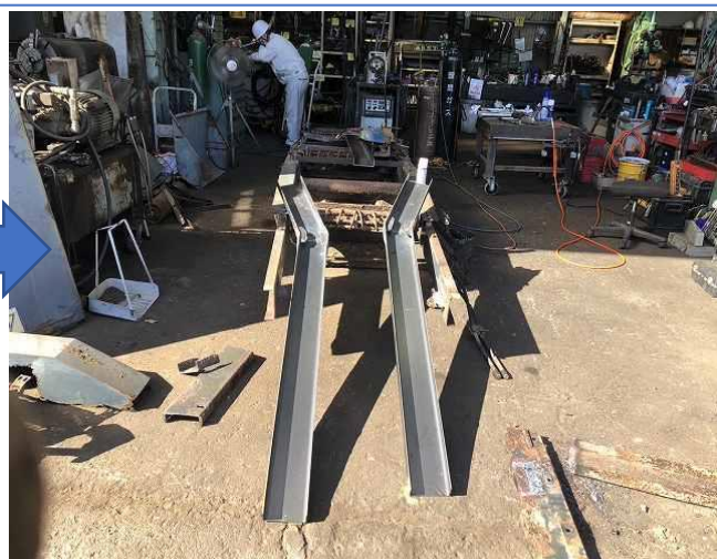
ベルコンフレーム腐食のためフレーム製作