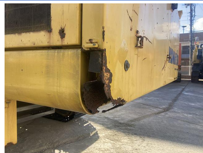
トルクレンチ収納カバー破損