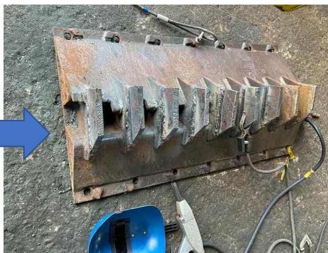
サイドコーム偏摩耗部補修