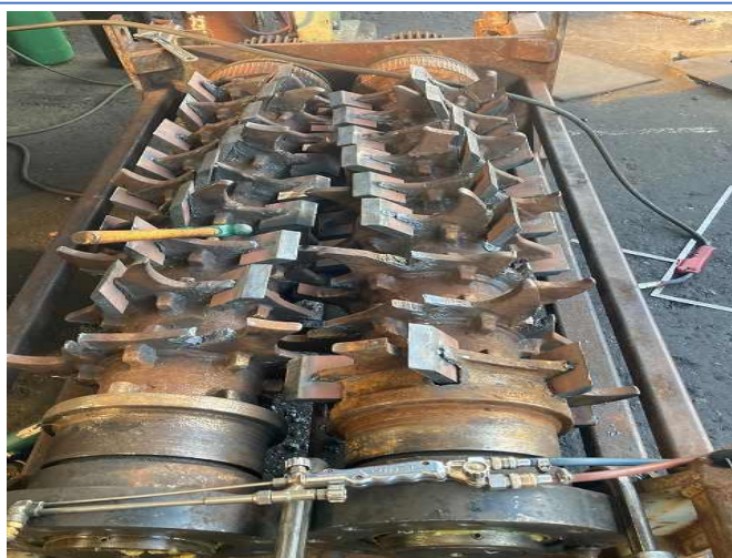
破砕シャフトベアリング両側交換