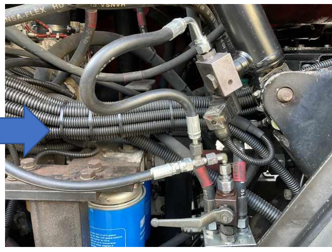
バルブ間油圧ホース2本油漏れの為交換