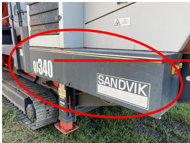
サイドカバーダンパーへたり①