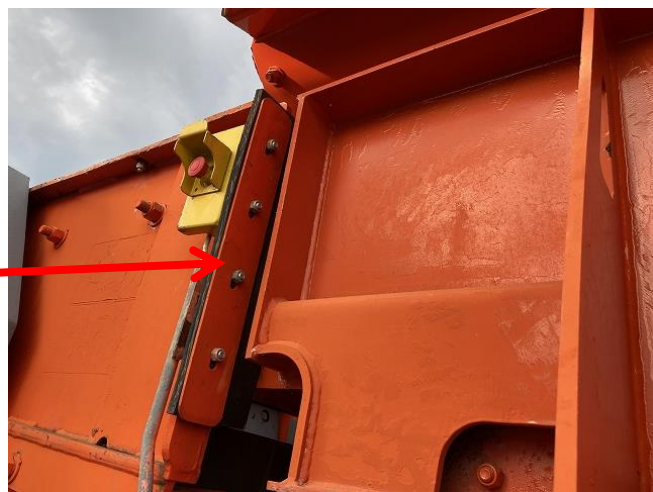
再塗装によるムラ②