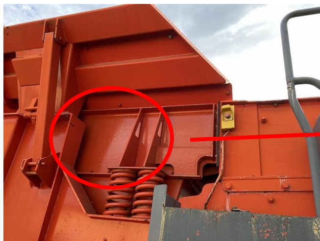
再塗装によるムラ①