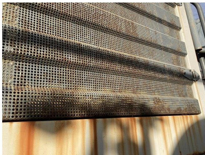
ラジエターグリル錆び