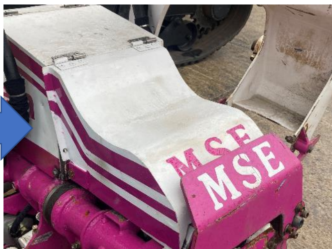
アタッチメント 外装板金、塗装