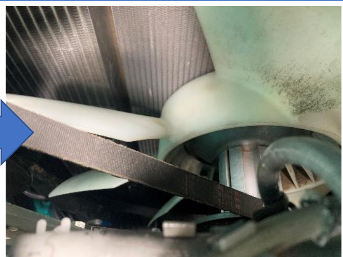
エアコンベルト交換