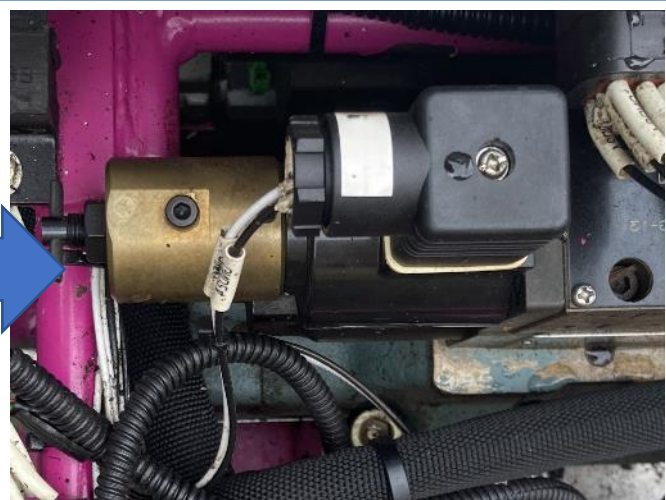
アタッチメント ソレノイド配線修理