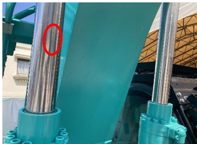
ブームシリンダー打痕あり