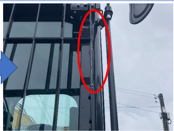
CABフロントガード板金