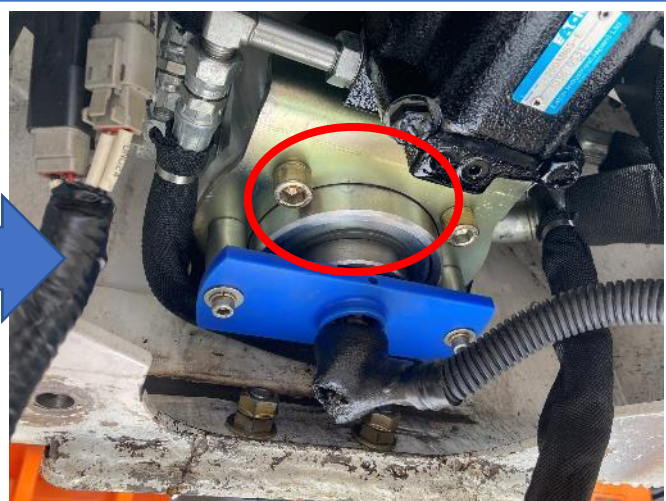
アタッチメント 油漏れ修理