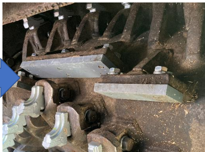
破砕室 ウィングプレート交換