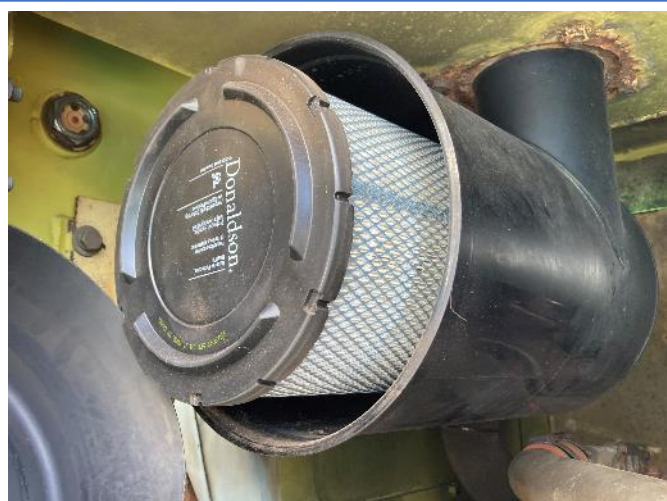
エアエレメント交換