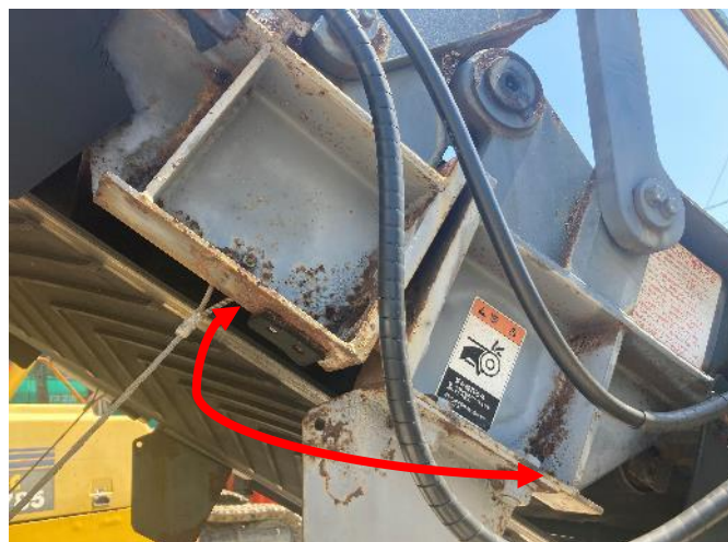
排出コンベア折畳動作遅い