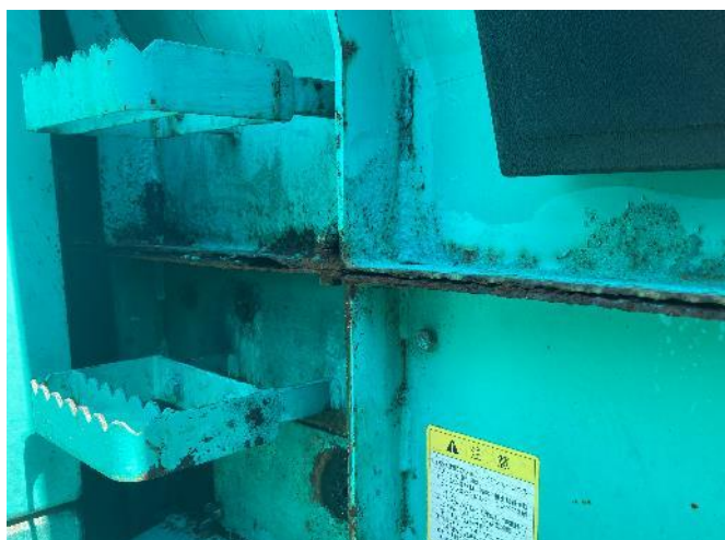
外装フレームサビ腐食散見