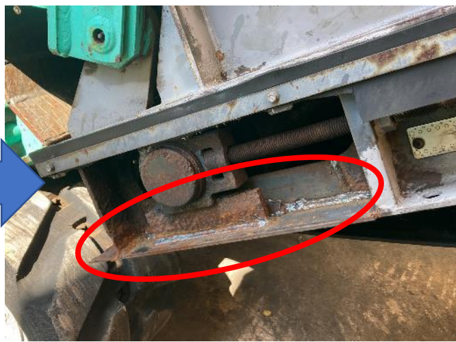
排出コンベアフレーム腐食部補修