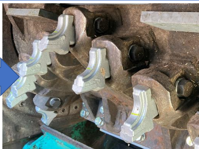
破砕室 破砕ビット交換