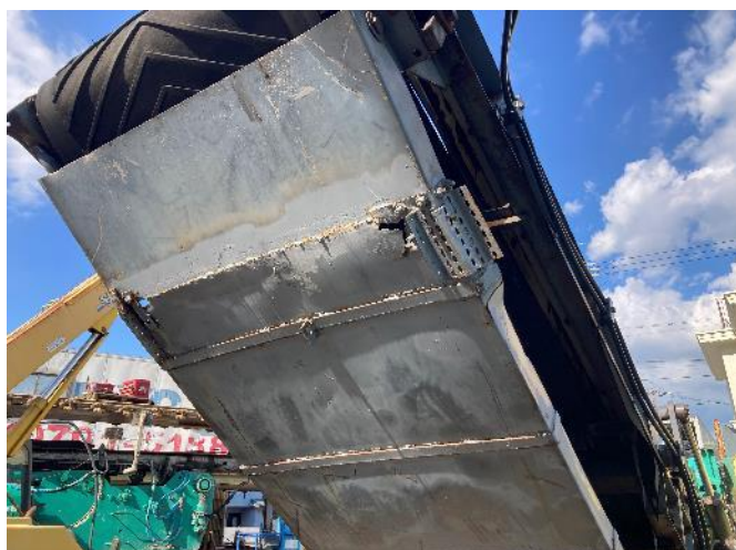
磁選機シューター補修跡