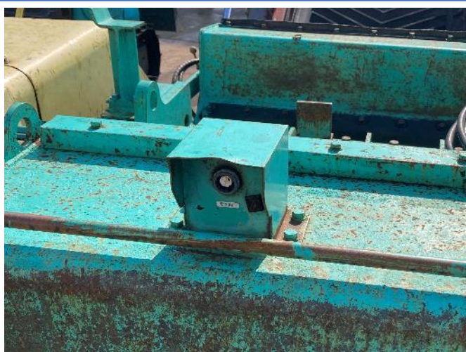
投入口非常停止スイッチ破損