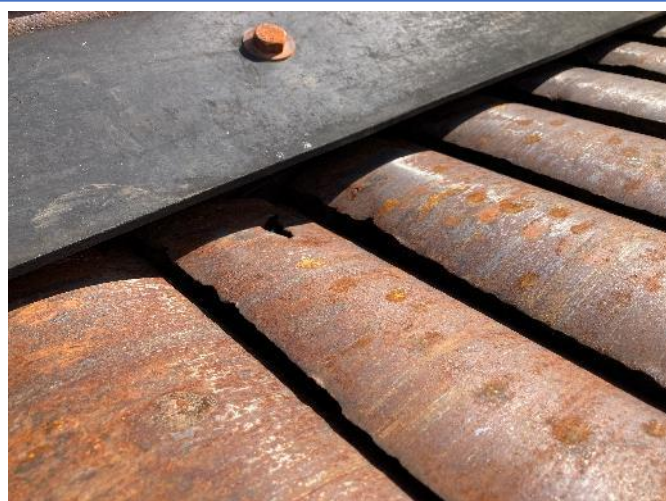
フィーダープレート摩耗