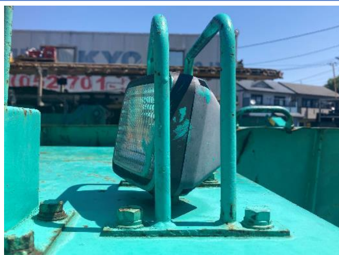
走行用ライト不灯