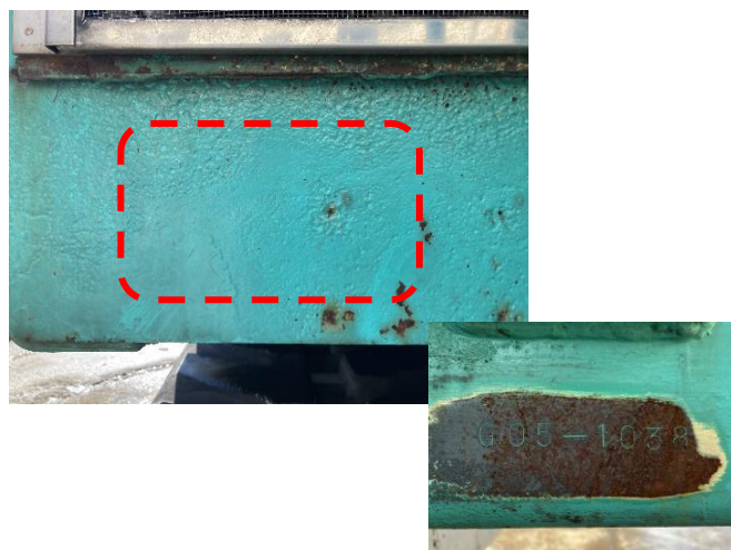
機体銘板欠損(刻印確認可能)