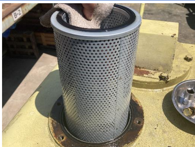
作動油エレメント交換