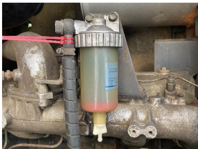
燃料エレメント交換