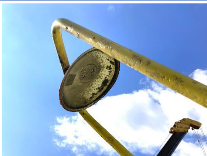
ミラーレンズ欠損