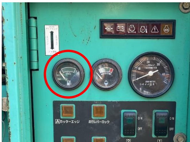
操作盤側 燃料ゲージ不動