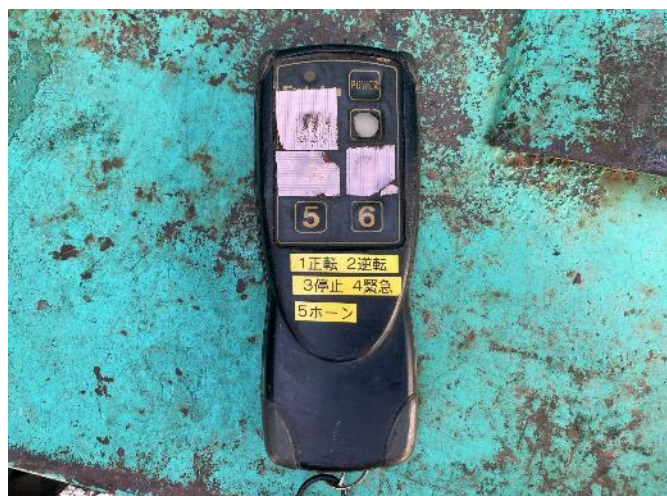
ラジコンボタン部剥離