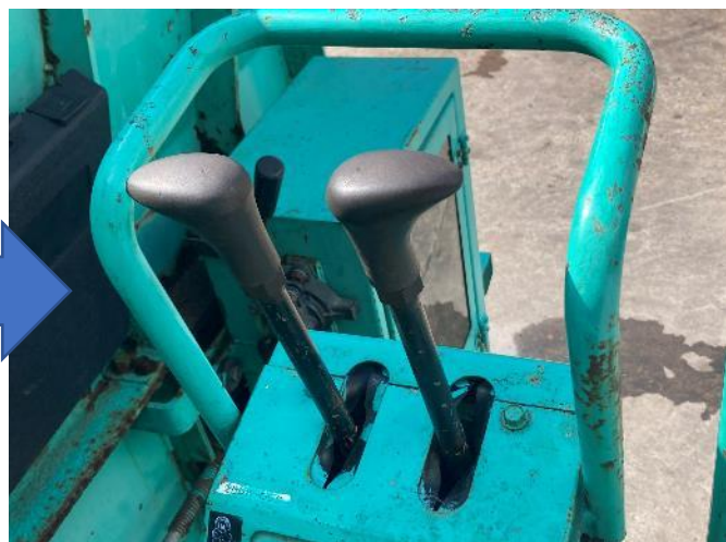
走行レバー ワイヤー交換