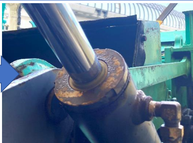
排出コンベア 折畳シリンダー油漏れ修理